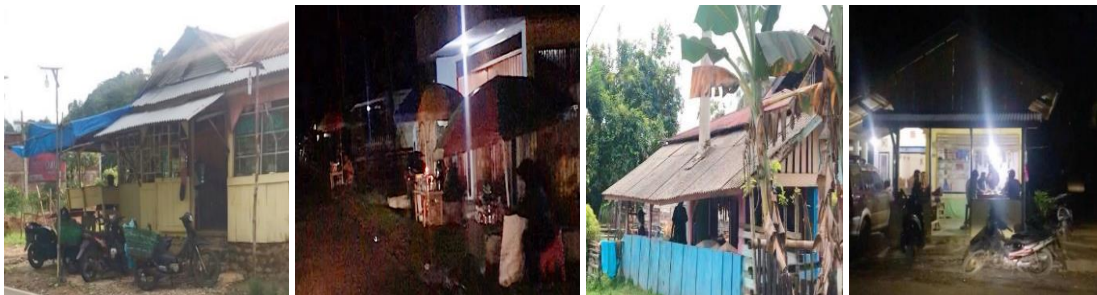
Gambar 1. Lokasi Penjual Minuman Keras Ilegal

Sebagai yang terlihat pada gambar yang dilampirkan, terdapat beberapa botol bir yang tersedia dengan mudah dan tersebar di berbagai tempat. Fenomena ini menunjukkan bahwa minuman keras dapat didapatkan dengan mudah, bahkan tanpa pengawasan yang memadai. Keberadaan penjual minuman keras ilegal di lingkungan tempat tinggal dapat menjadi faktor yang signifikan dalam meningkatnya. Ketersediaan yang mudah diakses oleh remaja dan adanya tempat untuk berkumpul menciptakan peluang (Rori, 2015). Hasil penelitian menunjukkan tersedianya minuman keras di enam tempat, sehingga remaja tidak mengalami kesulitan untuk mendapatkannya, dan tempat tersebut buka hingga larut malam.