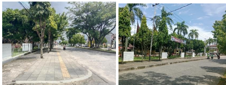
Gambar 2. Trotoar

Dari peta di atas, dapat dilihat bahwa Kelurahan Cupak Tengah terbagi menjadi 6 RW dan 21 RT. Lokasi trotoar yang dipakai oleh PKL sendiri terletak di RT 03/RW 01. Di dalam RW 01 terdapat 4 RT, dan wilayah trotoar itu sendiri berbatasan dengan RT 04 pada bagian sebelah kiri BRI Corporate University. Panjang trotoar yang dibangun dan digunakan oleh PKL memanjang dari sisi sebelah kanan gerbang BRI Corporate University sampai dengan halte bus. Penulis mengajukan gambar trotoar sebagai ilustrasi (Gambar 2).