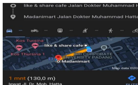
Gambar 3 Panjang Lokasi Berjualan PKL

Ukuran lokasi yang dipergunakan oleh PKL diperkirakan kurang lebih mencapai 130 meter dengan lebar perkiraan 3 meter, diukur menggunakan aplikasi Maps dengan menjadikan Cafe Like & Sare sampai dengan Madani Mart sebagai titik lokasi yang diperkirakan sama dengan jarak yang dipakai oleh para PKL. Peneliti mengajukan media pengukur sebagai berikut (Gambar 3).