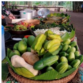
Gambar 3. Kuliner Rujak dan Pecel Sayur di Pasar Slumpring

Pengunjung dapat menikmati berbagai macam kuliner makanan dan minuman tradisional. Beberapa makanan tradisional yang dijual antara lain serabi, candil, cethot, gandos, blendung dari jagung, kapur, kue putu, nasi jagung, pecel, tahu aci yang menjadi makanan khas Kabupaten Tegal dan masih banyak lagi.