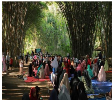
Gambar 1. Suasana Pasar Tradisional Slumpring di Tengah Hutan Bambu

Proses terbentuknya Desa Wisata ini dimulai pada tahun 2016 yang mana Pokdarwis setempat membuka sebuah destinasi wisata mata air “Tuk Mudal” sekaligus digunakan untuk pengairan di kawasan hutan bambu yang sekarang digunakan sebagai lokasi Pasar Slumpring. Wisata mata air tersebut berhasil menarik minat pengunjung di awal pembukaan tetapi mengalami kemunduran dikarenakan destinasi yang ditawarkan terkesan membosankan. Pokdarwis mulai mengembangkan gagasan wisata lain yang mampu mendorong peningkatan ekonomi masyarakat dengan memanfaatkan potensi wilayah Desa Cempaka yang lainnya.