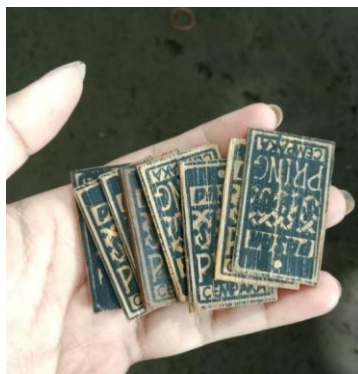
Gambar 2. Bentuk “Irat” Alat Tukar Transaksi di Pasar Slumpring

Sekitar pukul 07.00 WIB biasanya para pengunjung sudah mulai berdatangan, untuk pengunjung yang membawa kendaraan akan diberhentikan di pintu masuk oleh pengelola yang bertugas di loket tiket masuk sekaligus tiket parkir. Tiket masuk di Pasar Slumpring dikenakan tarif sebesar Rp 5.000/orang dan untuk tiket parkir kendaraan roda dua dikenakan tarif Rp 5.000/kendaraan dan kendaraan roda empat Rp 10.000/kendaraan. Beberapa pengelola pasar ditempatkan di area parkir untuk mengarahkan dan membantu para pengunjung yang membawa kendaraan.