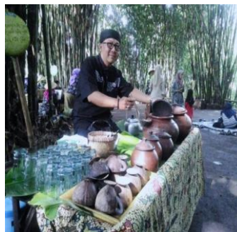
Gambar 4. Teh Poci Minuman Khas di Pasar Slumpring

Minuman yang dijual juga tidak kalah menarik, seperti wedang jahe, bandrek bahkan teh poci yang menjadi ciri khas minuman Kabupaten Tegal. Harga setiap makanan dan minuman disana bervariasi contohnya kue putu bisa diperoleh dengan menukarkan 1 irat , serabi seharga 2 irat , teh poci seharga 4 irat . Setelah mereka membeli makanan dan minuman yang diinginkan, pengunjung dapat mencari tempat duduk lesehan berupa tikar dari bambu dan tikar anyaman yang sudah disediakan oleh pengelola pasar yang berada di depan arena panggung hiburan. Selama proses interaksi yang ada di Pasar Slumpring, pengunjung akan lebih banyak diajak berkomunikasi dengan menggunakan bahasa Jawa krama, baik dari pedagang maupun pengelola pasar.